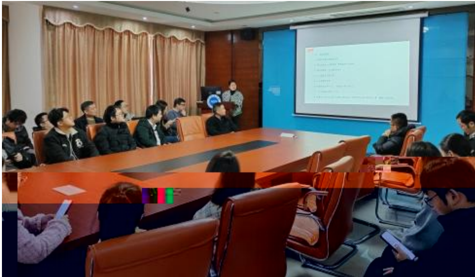
图 员工专业技 培