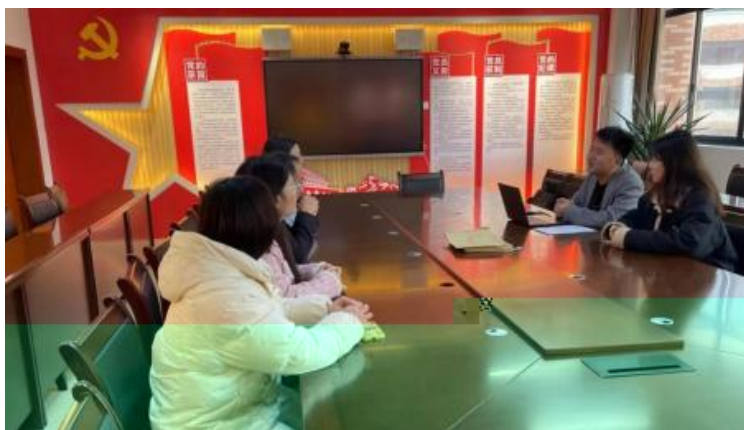
图 企开展学术 交 会