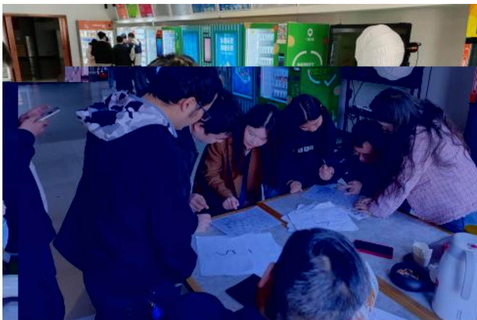
图 卓 团 建 共