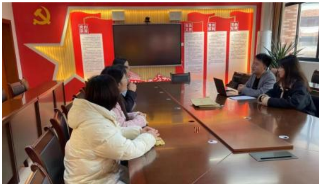
图 校企开展学术研讨项目交流会议

公 高度 队的 ，充分 到 和 的关 ，对 高 和 关 的 。此公 供 ，包 更 、 方法 及 导 发 程，并 持 丰富 的 家 过 、 会和 际案 ， 队 分 的 和 。 常 地 活动， 包 参加 会 、 等 ， 促 间 的 分 ， ， 并 的 队 ( 1)。