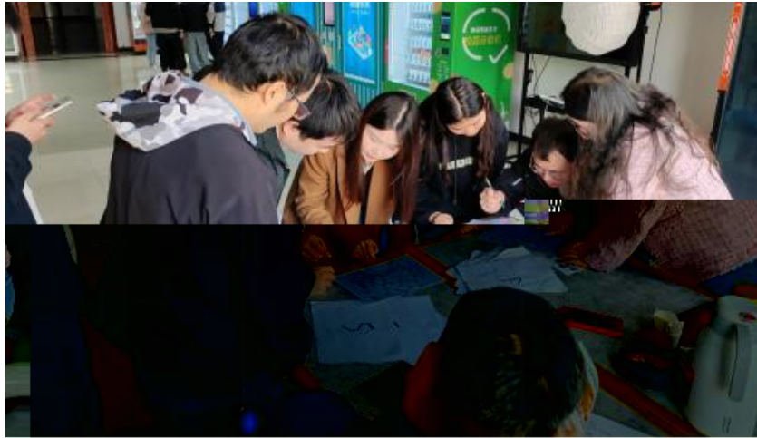
图 卓越团队建设共识营