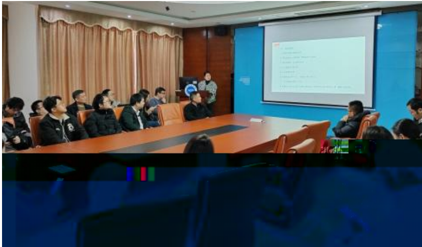
图 员工专业技能培训

2023 年，公司 促 进 发 展 和 才 方 得 成 功。 通 过 创 新 的 和 策 略， 不 断 动 公 司 的 持 续 成 长， 工 供 应 的 发 展 机 会。 通 过 供 多 样 化 的 和 发 展， “ 队 伍 共 建 ” 等 活 动 ( 4-5)， 帮 助 工 技 术 和 管 理； 并 通 过 的 和 规 划， 工 的 合 作 和 包 导 发 展 计 划、 技 术 及 部 等， 地 促 进 工 的 方 发 展。